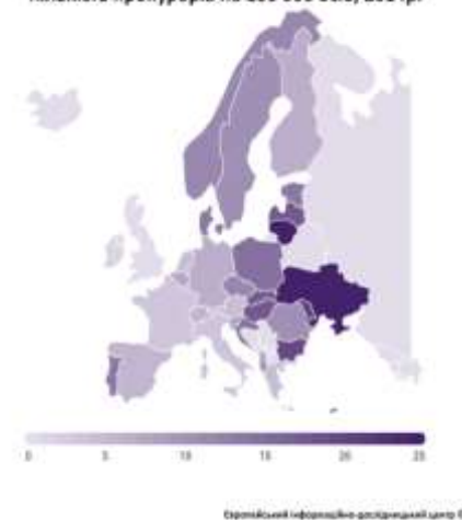
Кількість прокурорів на 100 000 осіб, 2014р.

Європейський інформаційно-політичний центр ©