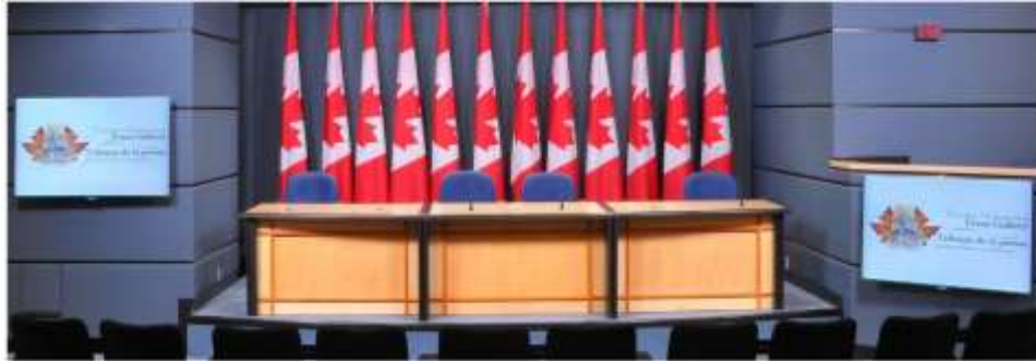
Фото 4. National Press Theatre

Кімната Чарльза Лінча (Charles Lynch Room). У цій залі передбачено: устаткування для телеконференцій; проектор та екран; телевізійні монітори для перегляду DVD-дисків; технічна підтримка; аудіо-та відеозйомку заходу. Прес-конференції у Charles Lynch Room повинні тривати не більше 30 хвилин. Фойє за межами зали засідань є одним з основних місць для інтерв'ю з депутатами: