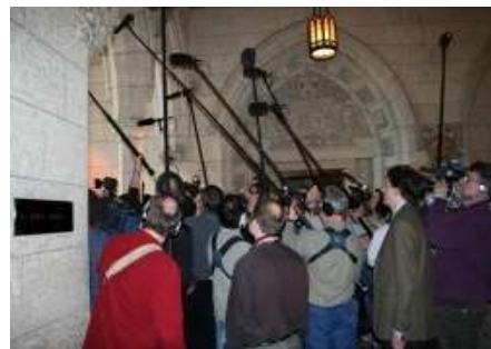
Фото 5. Фойє, де журналісти беруть інтерв'ю

Також щороку проводиться Прес-вечеря з журналістами . Захід не транслюється. Взяти участь у ньому можуть лише ті журналісти, які є членами Канадської Прес-Галереї .