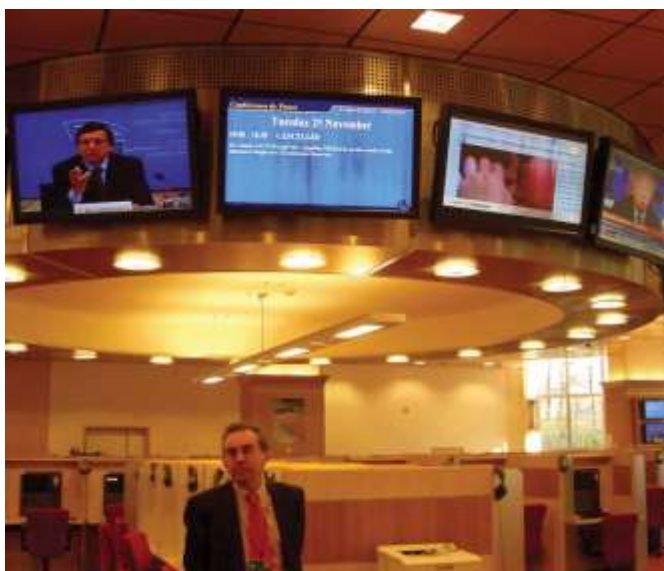
Фото 7. Прес-зал у Європейському парламенті

Прес-служба Європейського Парламенту забезпечує роботу гарячої лінії для журналістів , яка надає актуальну інформацію представникам ЗМІ. Співробітники прес-лінії володіють кількома мовами і добре орієнтуються в роботі європейських інститутів. Також надається інформація про брифінги та майбутні заходи. 26