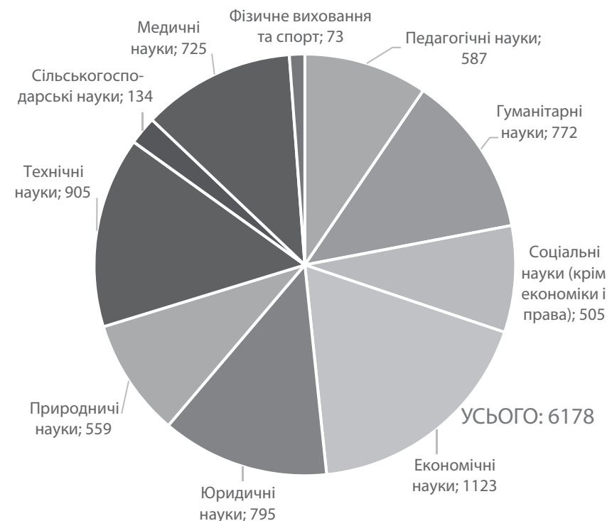
Рисунки 1. Кількість кандидатських дисертацій, захищених в Україні у 2014 р.

За наведеними цифрами можна сказати, що проблема захисту дисертацій прямо або опосередковано стосується понад 50 тис. українців, а також безпосередньо впливає на розвиток наукових досліджень, сфери вищої освіти та економіки в цілому.