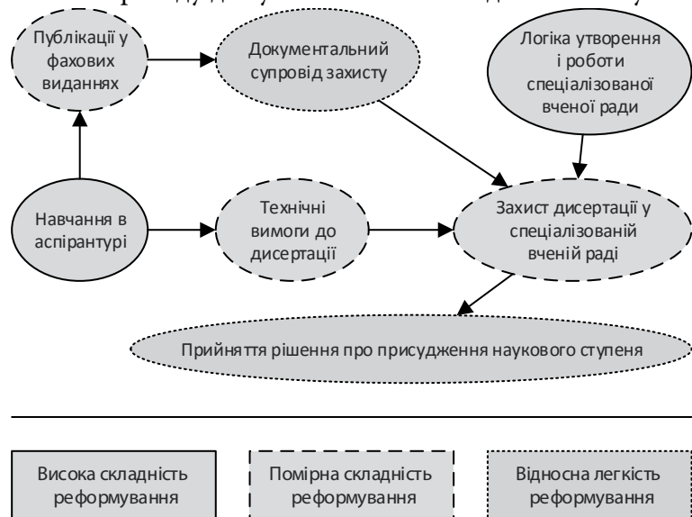
Рисунок 2. Складові системи здобуття наукового ступеня, що потребують реформи

Процес підготовки здобувача першого наукового ступеня (кандидат наук / доктор філософії) та захисту його дисертації має декілька складових (етапів), наведених на рис. 2. Кожна з цих складових потребує більших або менших реформ у контексті переходу до сучасної системи підготовки наукових кадрів.